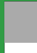
1/4 Seite Breite 210 mm Höhe 74 mm

Achtung: Alle angeschnittenen Formate zzgl. mindestens 3 mm Beschnitt.