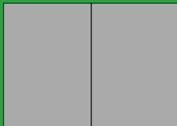
2/1 Seite Breite 420 mm Höhe 297 mm