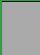
1/1 Seite Breite 210 mm Höhe 297 mm