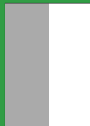
1/2 Seite Breite 105 mm Höhe 297 mm